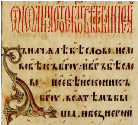
Устав Евангелия 15 в.

В ранних памятниках древнерусского языка слова не отделяются пробелами.