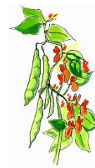
5. attēls. Turku pupas

Turku pupas – kāršu pupas; pupas, kurām nepieciešams balsts, ap ko vīties.