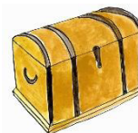
9. attēls. Lāde