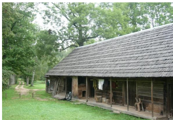
6. attēls. "Riekstiņi": klēts

Tad nāca kalpu klēts. Tai nebij kārtīgi aiztaisītas kraškas. Pār sijām bija tikai