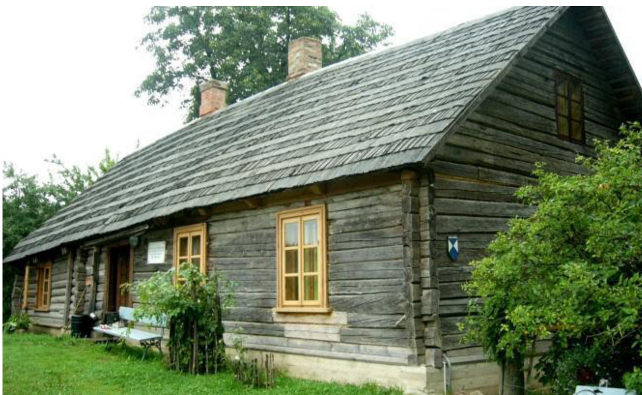
3. attēls. “Riekstiņi”: dzīvojamā māja