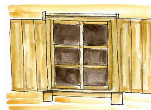
2. attēls. Slēgi

Slēgi – loga sānu malās (parasti ēkas ārpusē) iestiprinātas virināmas (parasti koka) plāksnes logu aizsegšanai.