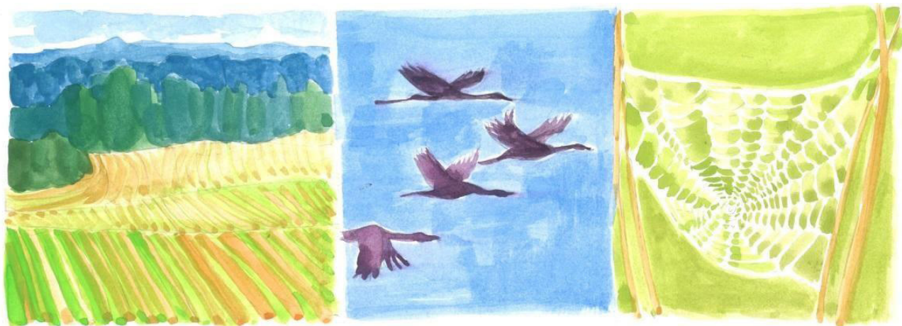
1. attēls. Ainava

6. uzdevums. Aplūko attēlus un izvēlies vienu, kuru tu izmantotu dzejoļa ilustrācijai! Pamato savu izvēli ar piemēriem no dzejoļa!