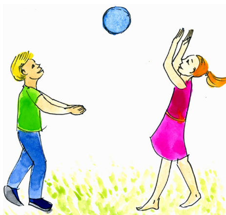
Spēles ar draugiem