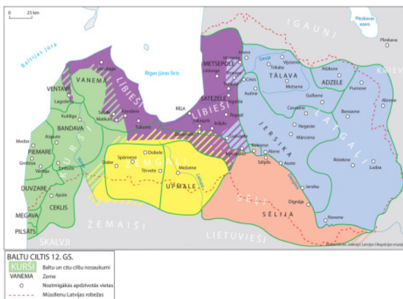
1. attēls. Latvijas teritorija 12. gadsimtā – cilšu teritorijas [tiešsaiste]. b. g. [skatīts 2020. g. 2. jūnijā].

Pasakas nosaukums, kuru lasīsi, ir Lībietis dūņās un miglā . Ar ko tev asociējas lībieši? Ko tu par viņiem zini? Kā tev atbildes sagatavošanā var palīdzēt attēlā redzamā karte?