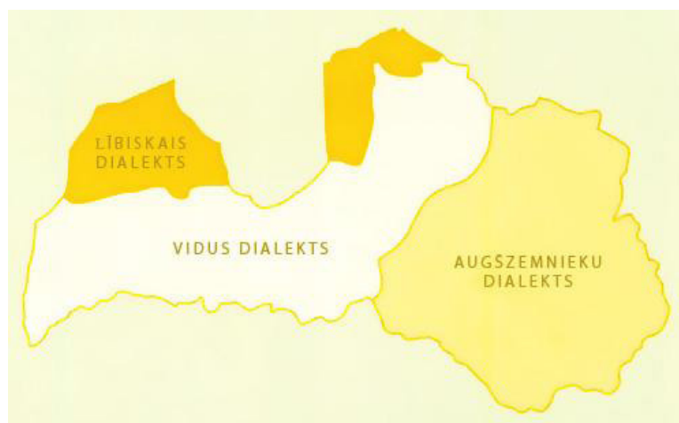
2.attēls. Latviešu valodas dialekti [tiešsaiste]. b. g. [skatīts 2020. g. 2. jūnijā].

Valsts nodrošina lībiešu valodas kā pirmiedzīvotāju (autohtonu) valodas saglabāšanu, aizsardzību un attīstību. (Valsts valodas likums, 4. pants)